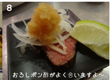
8 おろしポン酢がよく合いますよ～