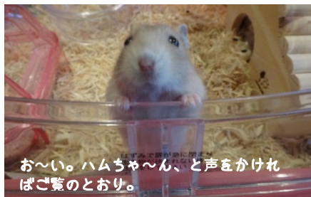
お～い。ハムちゃん、と声をかければご覧のとおり。

ペットショップで娘が一目ぼれしました。それにしてもびっくりしたのはペットショップに売っていたグッズの数々。ハムスターのお家はともかく、陶器でできたハムスターの便器、寒くないようにと電気ヒーター付のハムスターのベットなどなど、自分が子供の頃にはなかったものが、まさにハムスター様です。一通りグッズをそろえ、ハムスターを箱に入れてもらったのですが壊れてしまうのではないかと、慎重に家に連れて帰りました。小屋をセットして箱から移してやると、とってもおびえた様子で、ちょっとの物音でもビクビクしていました。ネットでいろいろ調べてみると、新しい場所に慣れるまで一週間位はご飯だけあげてそっとしておいた方が良くとのことでした。それから二週間位が経つと慣れてきたのかハウスの前に行くとき寄ってくることも。しぐさが本当にかわいくて、見ているとあっという間に30分、という事もしばしば。