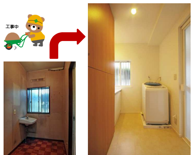
収納と洗面台の奥行はピッタリと一直線。圧迫は全く感じません。