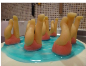
ジャ～ン！ 見事な演技ですね～！？