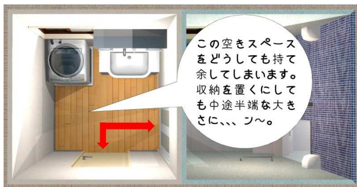
従来の洗面所のレイアウト