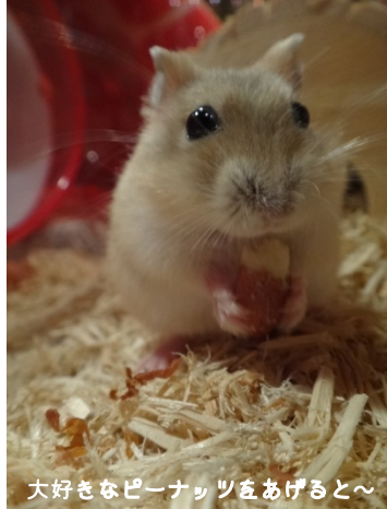
大好きなピーナッツをあげると～

我が家に新しい家族ができました。その名も“ハムちゃん”。はい、その通り、ハムスターです。娘の誕生日を機に飼うことになりました。その昔、ハムスターといえば茶色と白色の手のひらサイズと決まっていたのですが今では“ジャンガリアン”、“チャイニーズ”、“キャンベル”など種類もいろいろ。何だか美味しそうな名前ですよね。うちに来た子は“ジャンガリアンハムスターのプディング”という種類の子です。プディングとはプリンの中で、その名の通りプリン色の可愛子ちゃんです。