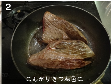
2 こんがりきつね色に