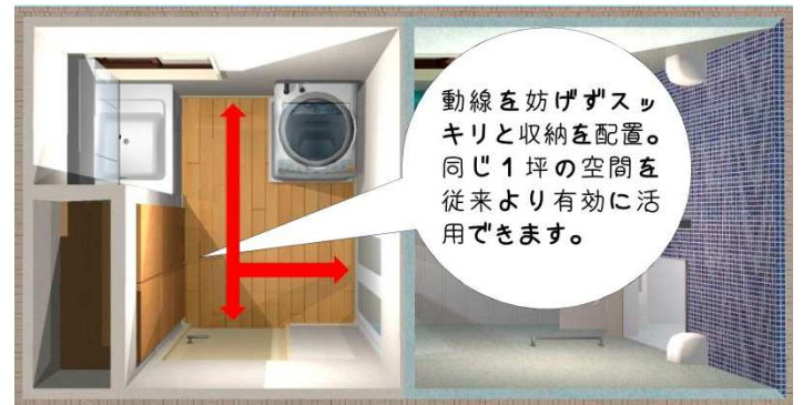
今回ご提案の収納たっぷりプラン