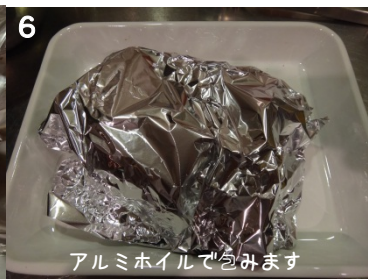
6 アルミホイルで包みます