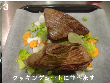
3 クッキングシートに並べます