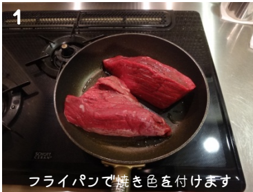
1 フライパンで焼き色を付けます