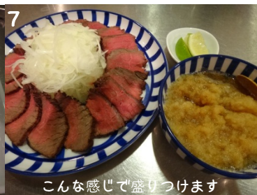
7 こんな感じで盛りつけます